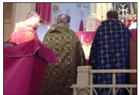
St. Vartan held a vigil service on August 18, in memory of victims at the Surmalu Shopping Center explosion in Yerevan.