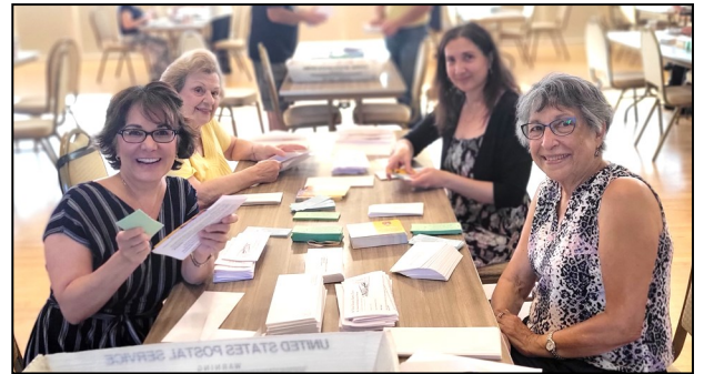
Food Festival Envelope Stuffing Party — August 18