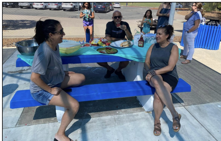
ACYO Pool Party and Barbecue August 28, 2022