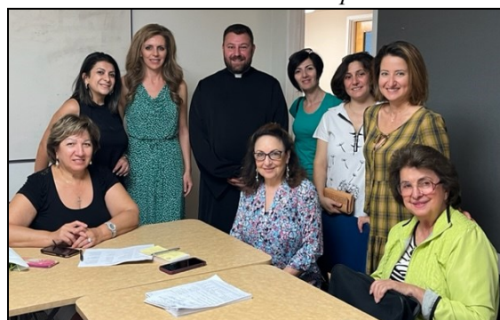
Armenian School Teachers and ARS Members met to register students for Armenian School.