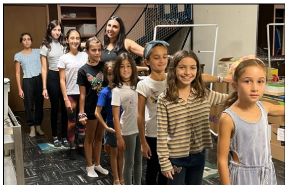
Festival Dance Troupe