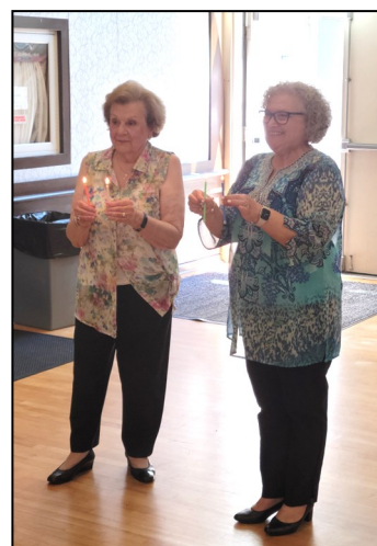
Western Diocese Ladies Society Regional Town Hall Meeting — August 20, 2022