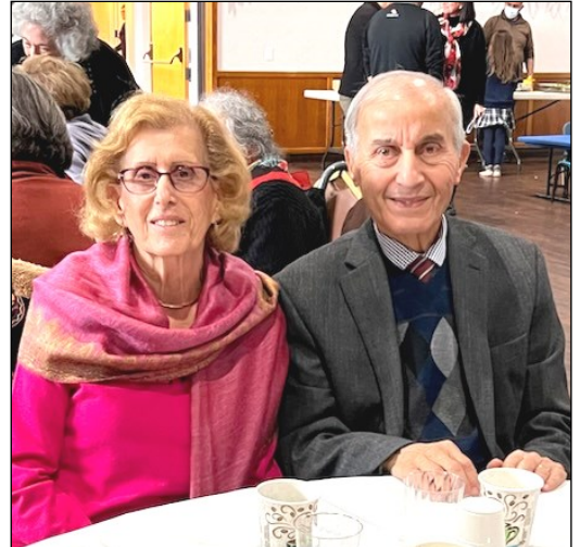
On December 6, several St. Vartan members enjoyed the NorCal Armenian Senior Services Christmas party in Burlingame.